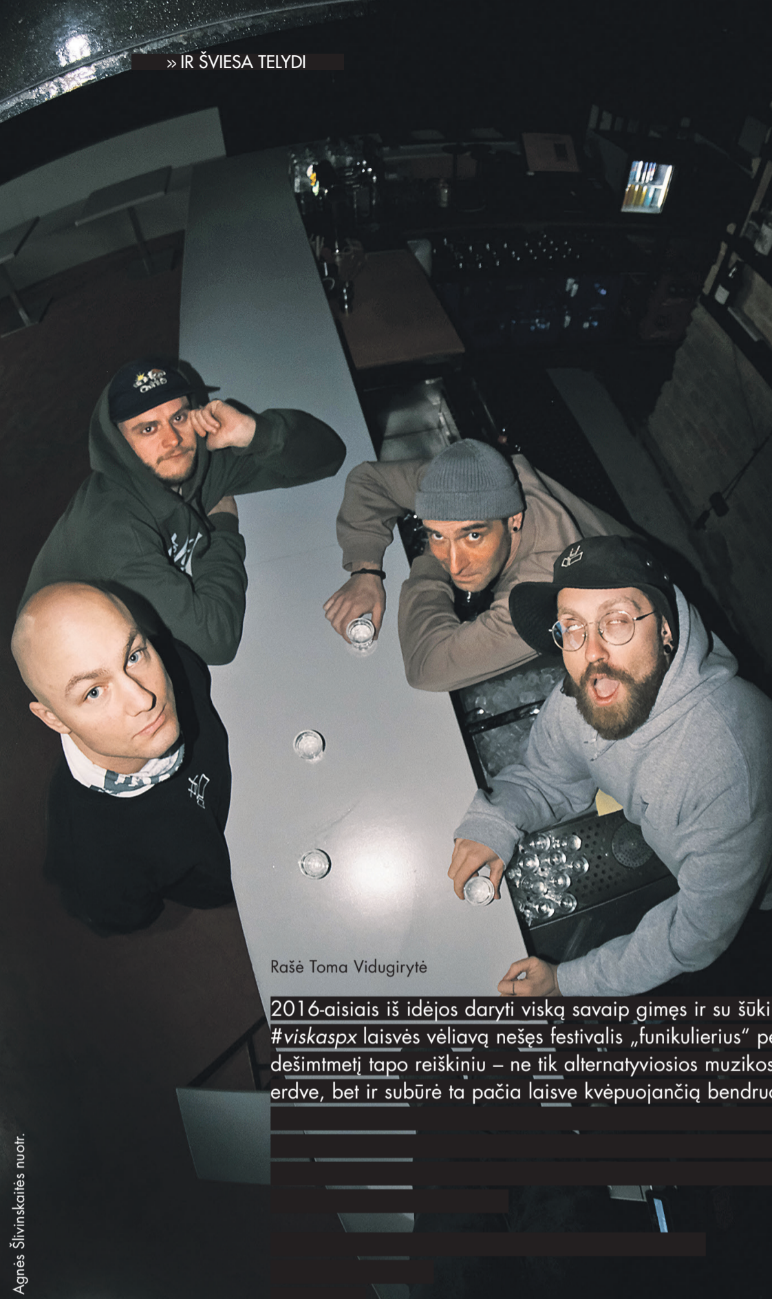
Rašė Toma Vidugirytė

2016-aisiais iš idėjos daryti viską savaip gimęs ir su šūkiu #viskaspX laisvės vėliavą nešęs festivalis „funikulierius“ per dešimtmetį tapo reiškiniu – ne tik alternatyviosios muzikos ir kultūros erdve, bet ir subūrė ta pačia laisve kvėpuojančią bendruomenę.