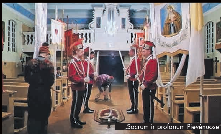
„Sacrum ir profanum Pievėnuose“