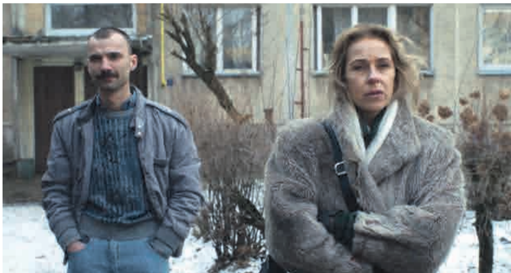
Kadrai iš filmo „Badautojų namelis“

O filmo scenarijų rašau apie vienuolyną, į kurį pasiprašo jaunas žmogus. Tai vadinamasis kontempliatyvusis vienuolynas, gana uždaras. Galima sakyti, kad vienuoliai jame ruošiasi išėjimui iš šito pasaulio. Taigi į jį ateina jaunas vienuolis ir pradeda ardyti visą vienuolyno tvarką. Paaikškėja, kad vienuolyne yra didžiulių problemų ir dėl ir tikėjimo, ir visokių kitokių.